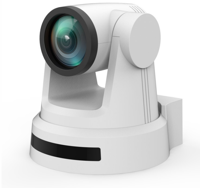
Поворотная камера серии КСС-В

Для проведения видеоконференций предусмотрена поворотная видеочамера, её предполагается установить на стене зала напротив президиума. 20-кратного трансфокатора хватит для того, чтобы можно было снимать как общий план сцены, так и крупным планом одного участника. Камера подключается непосредственно к ПК оператора по интерфейсу USB 3.0, для этого предусмотрен удлинитель USB по кабелю «витая пара».