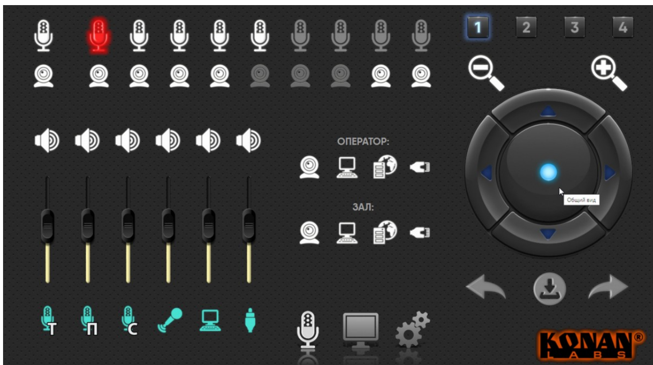
Заводской веб-интерфейс центрального блока KCS-TKR

Веб-интерфейс может быть переконфигурирован в соответствии с пожеланиями заказчика, однако для зала описываемой конфигурации этого не требуется – все необходимые элементы управления имеются на заводском веб-интерфейсе.