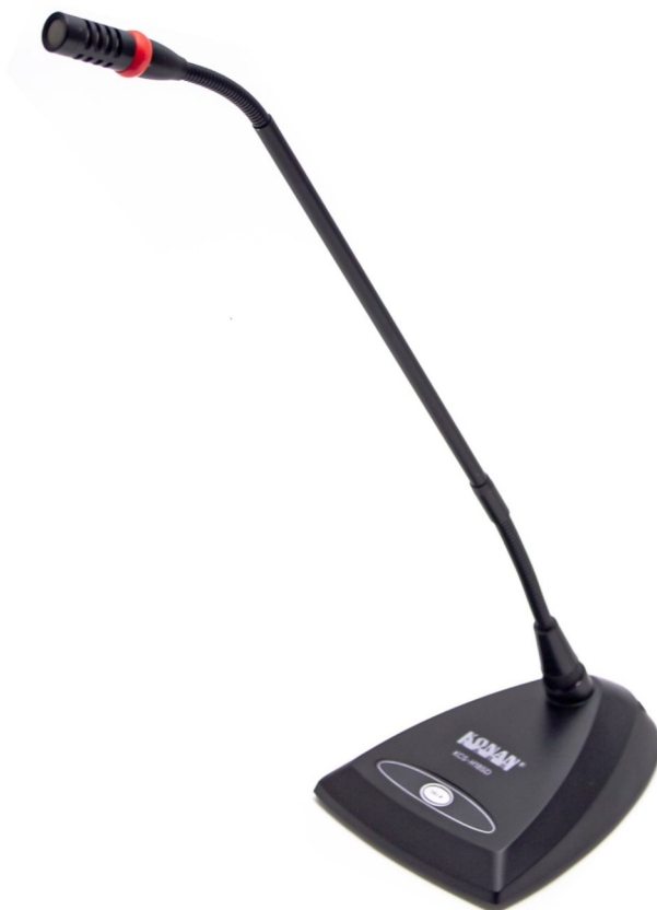
Настольный микрофонный пульт серии KCS-1185

микрофонов они отличаются тем, что работают в составе единой сети под управлением центрального блока конференц-зала. Центральный блок автоматически ограничивает количество одновременно включенных микрофонов, с тем, чтобы избежать возникновения акустической обратной связи (свист в колонках), а также осуществляет автоматическое наведение видеокамеры при включении микрофона.