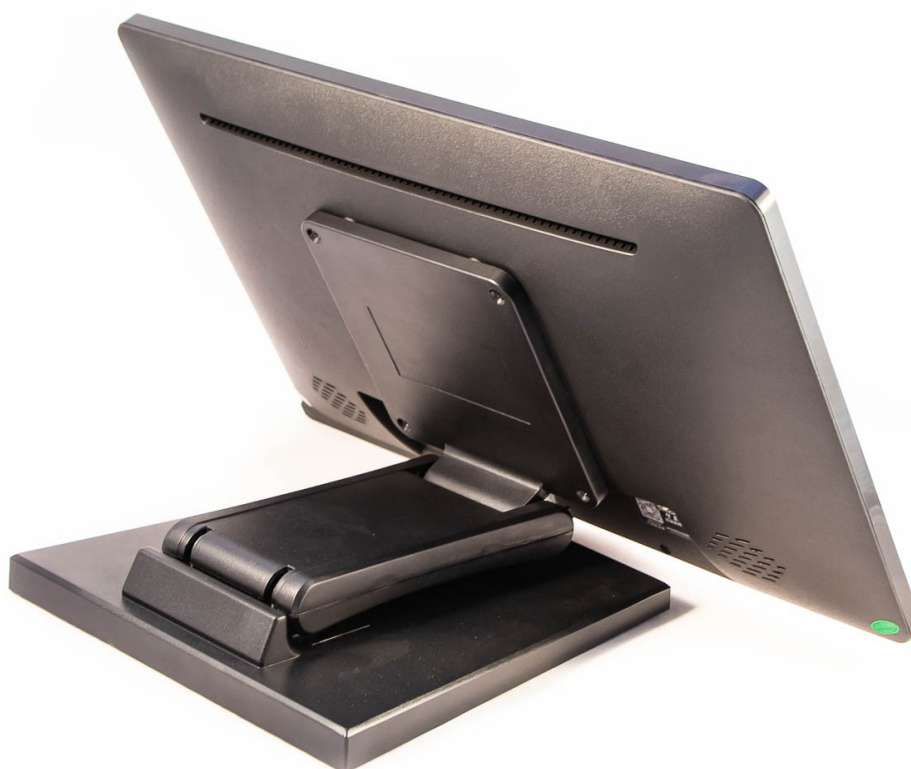
Настольный монитор на специальной подставке

Для отображения информации предусмотрен большой дисплей, который предполагается разместить на стене за президиумом. Для участников мероприятия в президиуме и у трибуны предусмотрены 6 настольных мониторов. Для них предусмотрены специальные подставки, которые позволяют установить монитор вплотную к поверхности стола, а также наклонить его на любой угол, таким образом можно обеспечить комфортное восприятие информации с монитора, при этом монитор не будет закрывать лицо участника мероприятия.